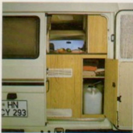
Von außen bequemes Einstellen der Gasflaschen und des Frischwassers, eigens zum Kochen