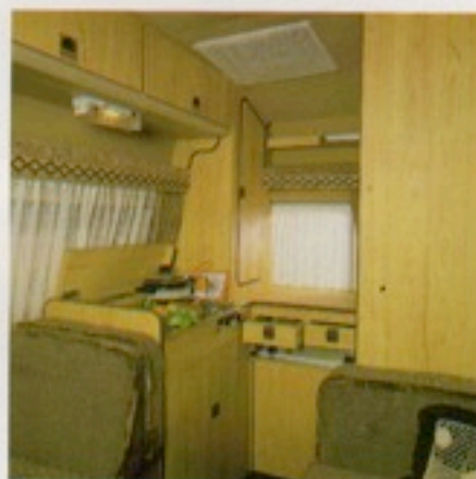
Kompakte Küche mit Spüle, viel Abstellplatz und Staumöglichkeiten. Schiebefenster und Dachlüfter für Dunstabzug