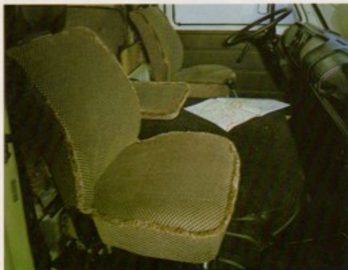
Nicht nur bequem, sondern auch optisch angepaßt: die Sitze im Fahrerhaus überzogen mit dem Polsterstoff des Wohnraums