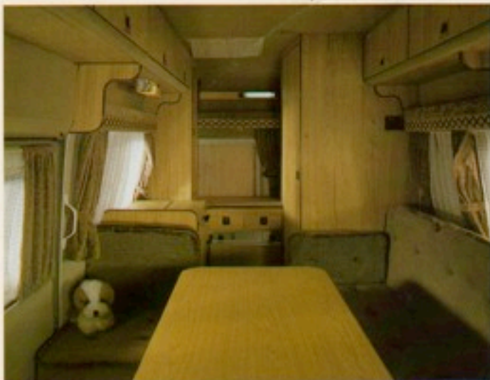
Blick vom Fahrerhaus in den Wohnraum: gediegen die Einrichtung, geschmackvoll die Farbabstimmung