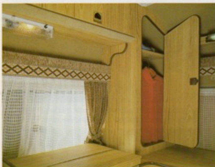
Auch Smoking und Abendkleid können mit: der Kleiderschrank (mit Wäschefach) sichert die Teilnahme an der Dinner-Party