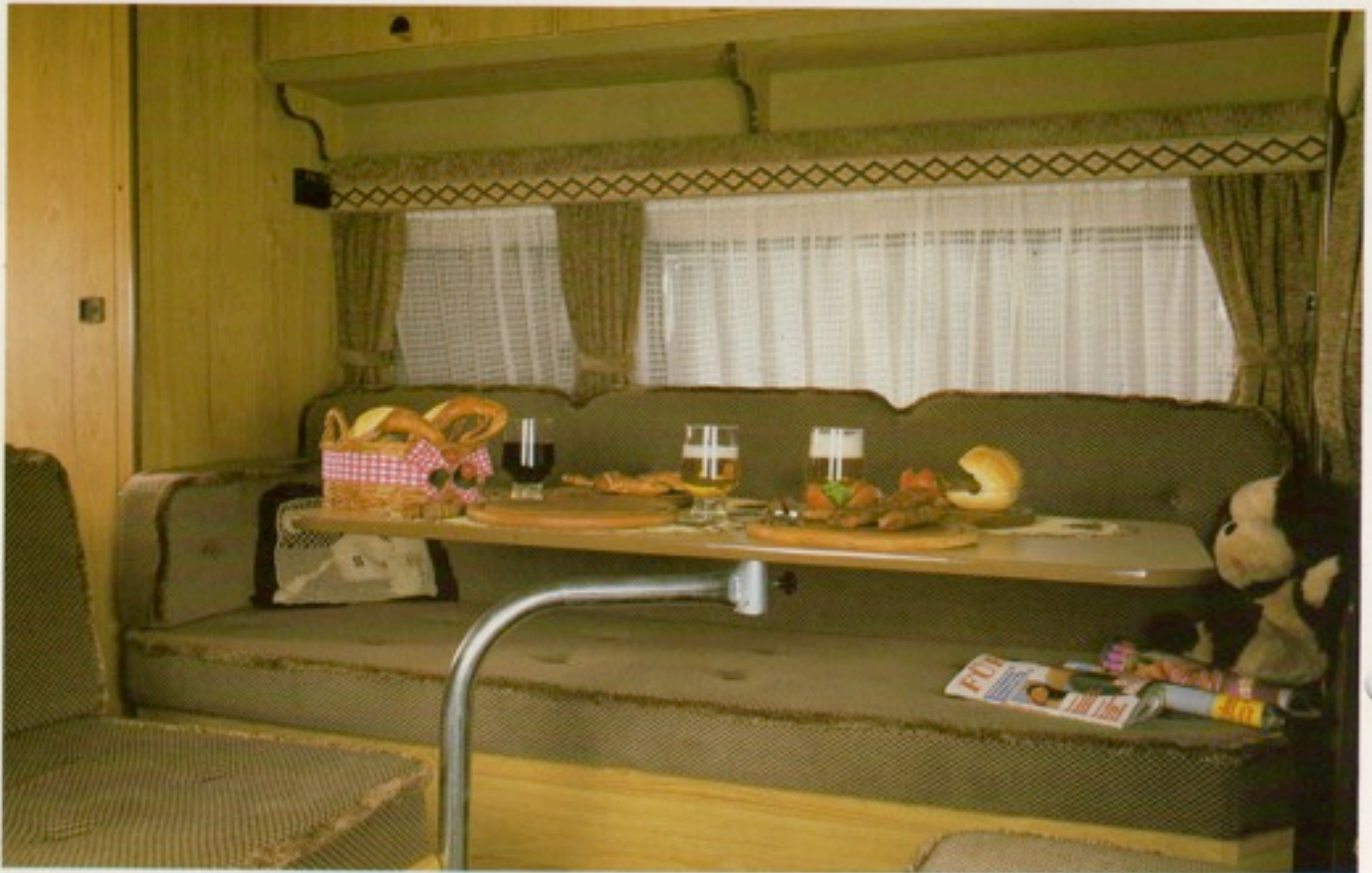
Ob Schwäbisches Vesper oder Bayerische Brotzeit – die gemütliche Sitzgruppe des LARGO bietet bis zu 6 Personen Platz zu einem »Picknick auf der Veranda«