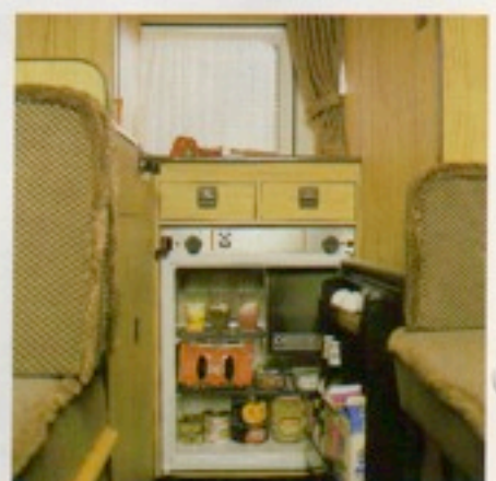
Der 60-l-Kühlschrank faßt so ziemlich alles, was die Familie auf Eis legen möchte