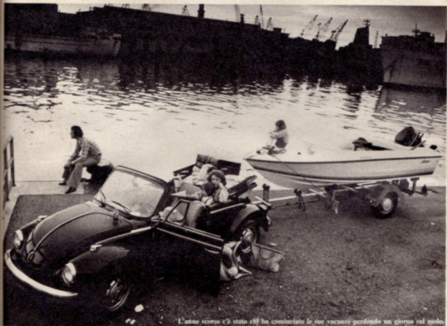
L'anno scorso c'è stato chi ha cominciato le sue vacanze perdendo un giorno sul molo.

Tutti gli anni è la stessa storia. Si prenota per tempo l'albergo, ma alla nave per arrivare il giorno stabilito si pensa soltanto all'ultimo minuto. E poi si vuol partire di sera, a tutti i costi.